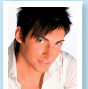
MARCO E I NIAGARA